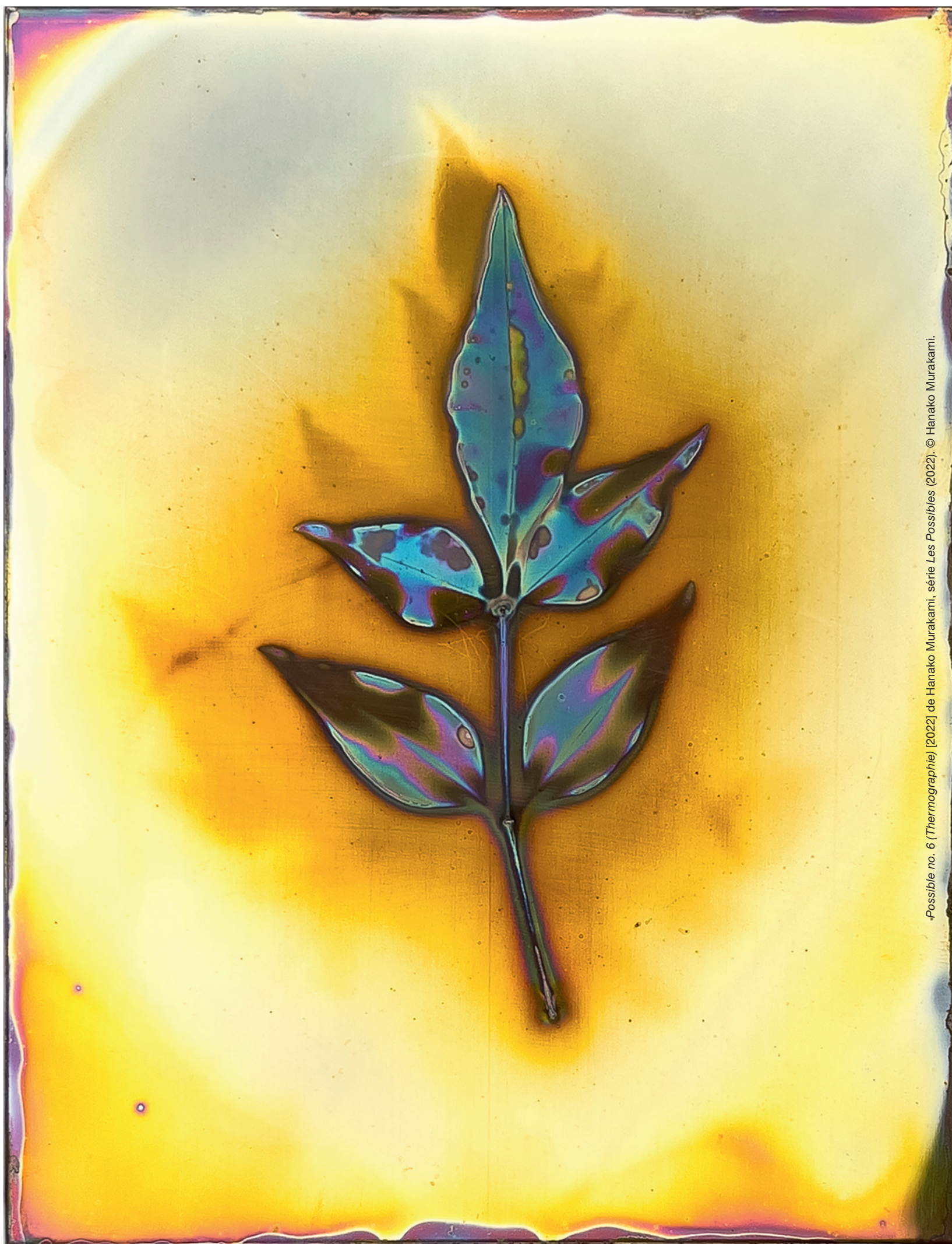
Possible no. 6 (Thermographie) [2022] de Hanako Murakami, série Les Possibles (2022), © Hanako Murakami.