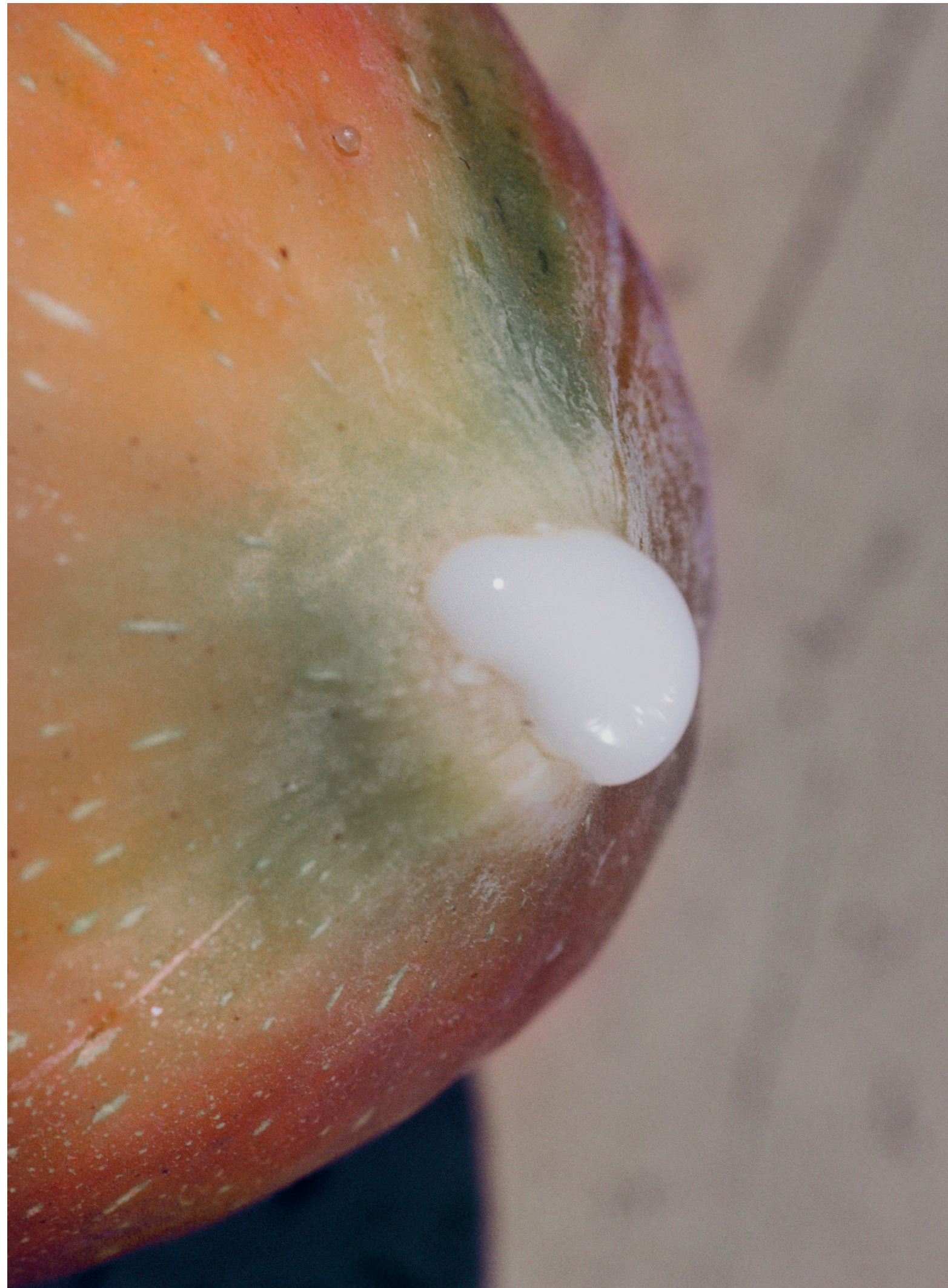
Sans titre, Birth (2021) de Lucile Boiron.